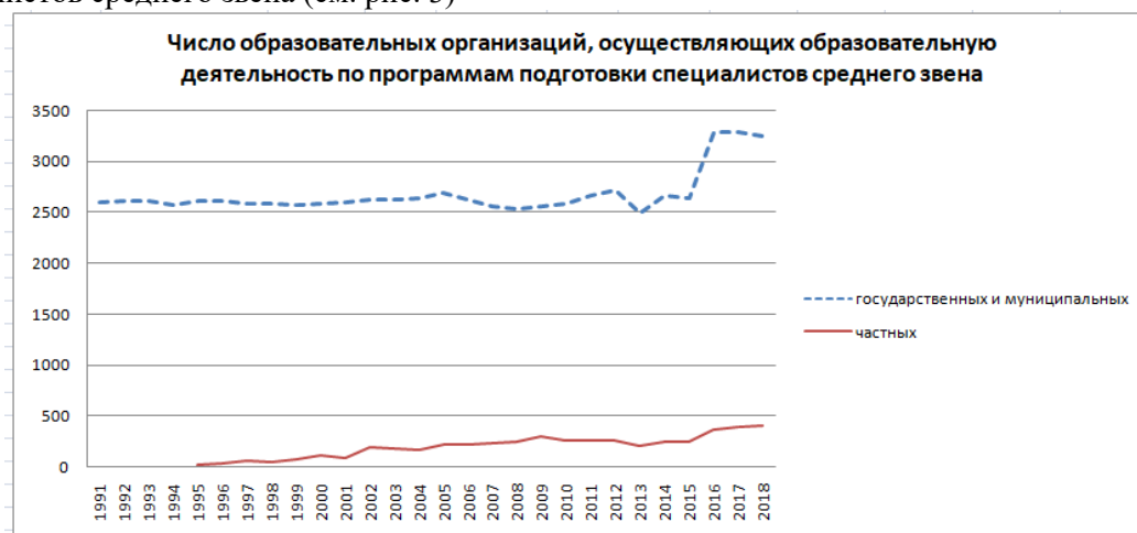
Рис. 3. Динамика изменения количества государственных и частных образовательных организаций, осуществляющих подготовку специалистов среднего звена

Но совсем по-другому обстоят дела в секторе образования, осуществляющим подготовку специалистов среднего звена (см. рис. 3)