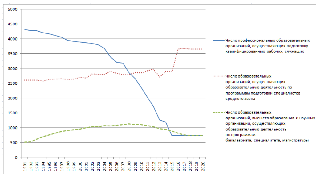
Рис. 2. Динамики изменения численности организаций и организаций, осуществляющих подготовку квалифицированных рабочих (служащих), специалистов среднего звена, специалистов с высшим образованием.

Таким образом, очевидно, что сокращение учебных заведений шло опережающими темпами, обгоняя сокращение количества учащихся в них. А это в свою очередь определило повышенную эксплуатацию зданий и всей материально-технической базы, а также повлекло интенсификацию труда педагогических работников. Данные цифры убедительно демонстрируют, что не рост рождаемости стал причиной переполненности детских садов и школ, а желание государства сэкономить на содержании зданий и сооружений, а также на оплате труда педагогических работников.